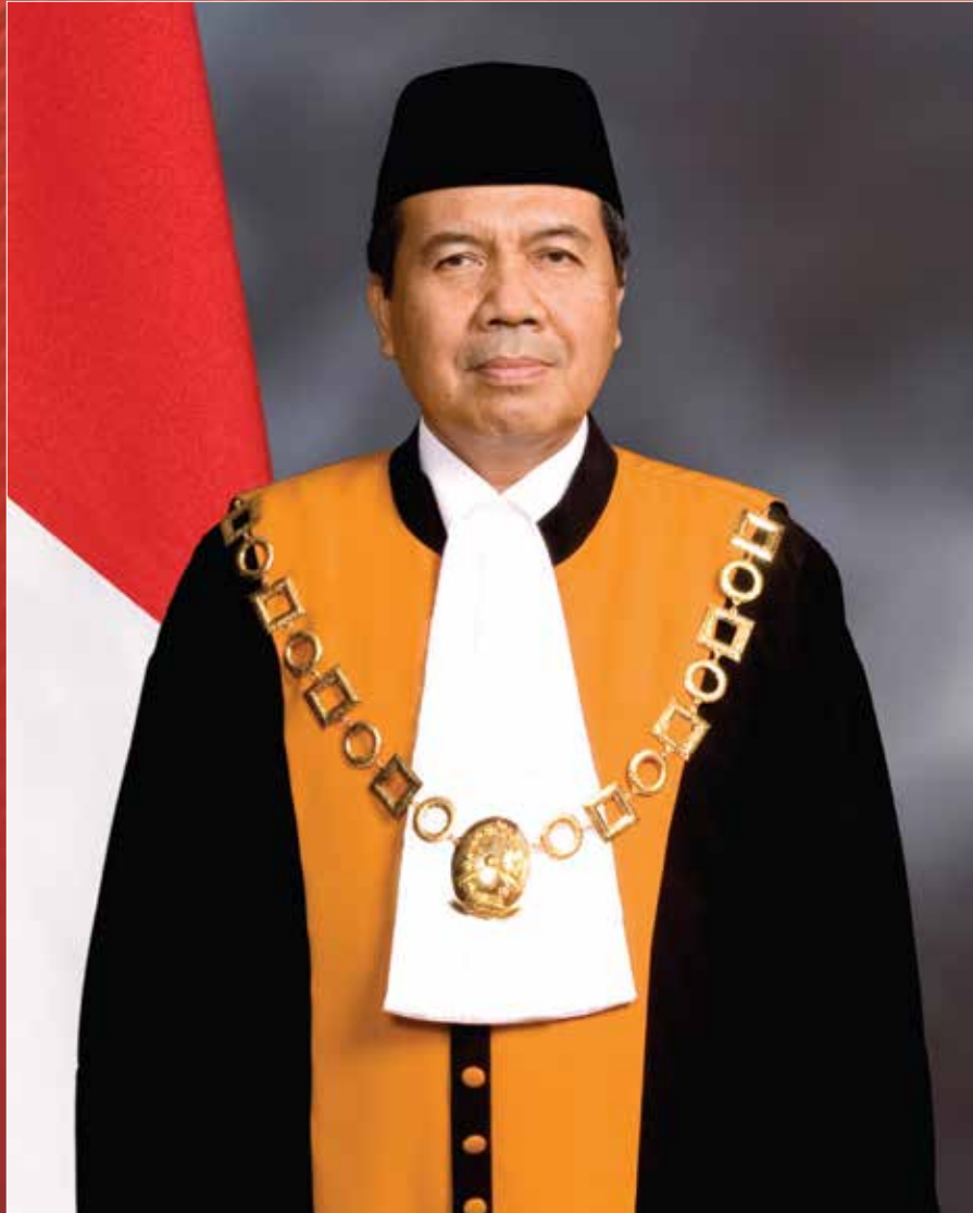
Prof. Dr. H. Muhammad Syarifuddin, S.H., M.H. Ketua Mahkamah Agung RI