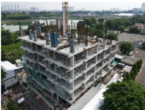
Gambar Pembangunan Rusun MA

Mahkamah Agung telah menjalin kerja sama dengan Kementerian Pekerjaan Umum dan Perumahan Rakyat sesuai dengan mekanisme yang diatur dalam Peraturan Menteri Pekerjaan Umum dan Perumahan Rakyat Nomor 1/PRT/M/2018 tentang Bantuan Pembangunan dan Pengelolaan Rumah Susun untuk Membangun Rusun bagi Hakim dan Pejabat Pengadilan di Wilayah DKI Jakarta yang berlokasi di Jalan Jenderal A. Yani No. 1, Kelurahan Kayu Putih, Kecamatan Pulogadung, Kota Administrasi Jakarta Timur. Lokasi pembangunan rusun ini merupakan optimalisasi terhadap aset bangunan gedung kantor eks Pengadilan Negeri Jakarta Timur dengan luas tanah sebesar 2490 m 2 . Pembangunan rusun yang berjumlah 8 lantai dan terdiri atas 69 unit itu dilaksanakan sejak tanggal 27 Agustus tahun 2021 dan diharapkan selesai pada bulan Juni tahun 2022. Progres pembangunan rusun sudah mencapai 35% per 31 Desember 2021.