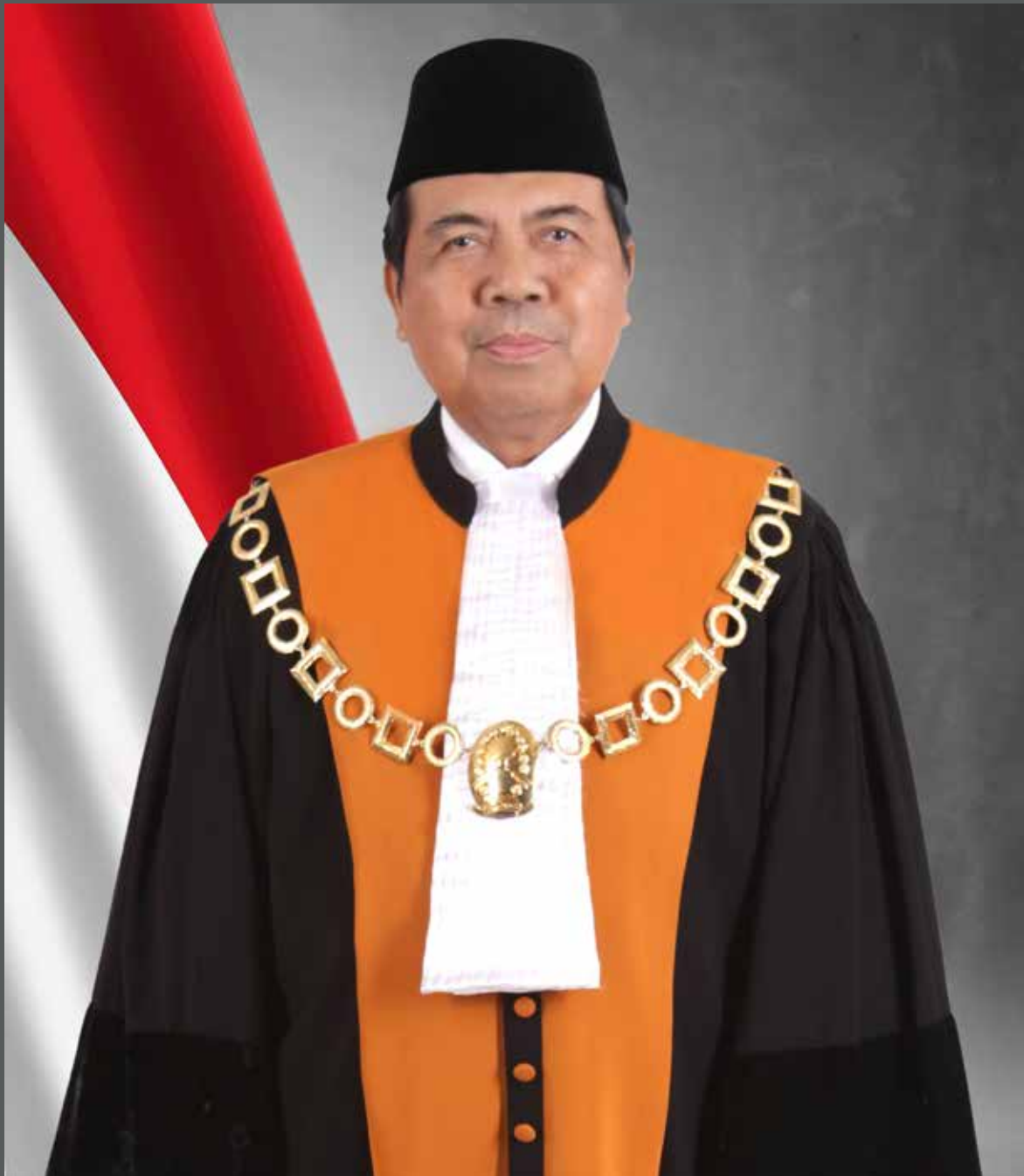
Prof. Dr. H. Muhammad Syarifuddin, S.H., M.H. Ketua Mahkamah Agung RI