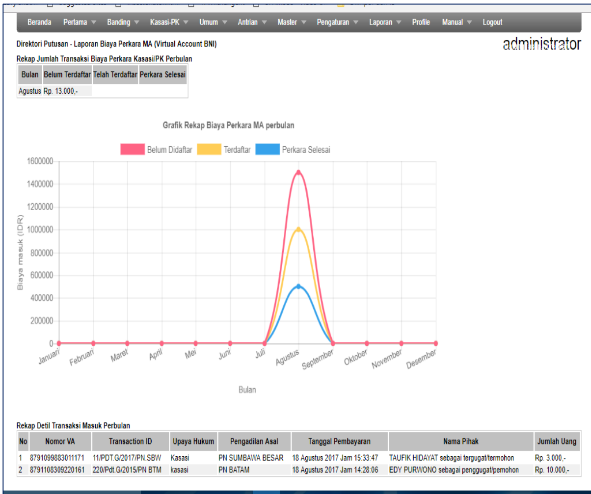
Gambar 8 : Halaman Laporan Rekapitulasi keuangan yang masuk pada rekening virtual BNI Syariah pada Admin Aplikasi Direktori Putusan