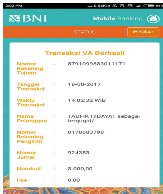
Gambar 7 : Contoh Notifikasi Pembayaran berhasil dilakukan pada halaman BNI Mobile